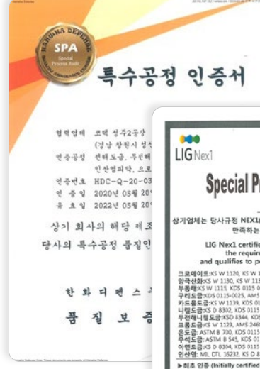
업계 표면처리 인증