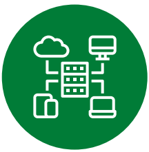
스마트 제품 입고

코텍의 차별화된 전산 시스템은 더욱 긴밀한 고객 맞춤 서비스를 실현합니다.