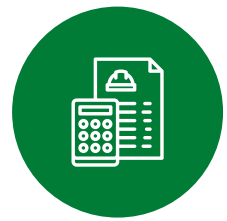
웹견적 시스템, 전산등록 시스템 (개발중)